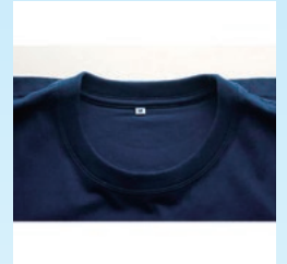
こだわりの4重フライス