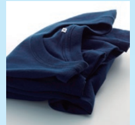
ソフトな糸によるふくらみ感